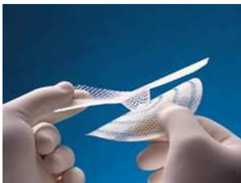
Příklad syntetického zpevňujícího materiálu

Ke zpevnění ochablé stěny a u recidivujících (opakujících) kýly se používá speciální syntetický materiál ve tvaru sítky, která plní funkci zpevňující tkáně a je pak oporou pro zeslabenou tkáň.